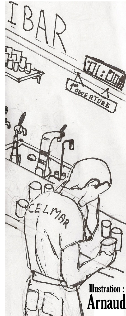
Illustration : Arnaud